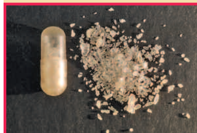
Méthamphétamine (ou « cristal meth »)