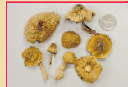
Psilocybine (« champignons magiques »)